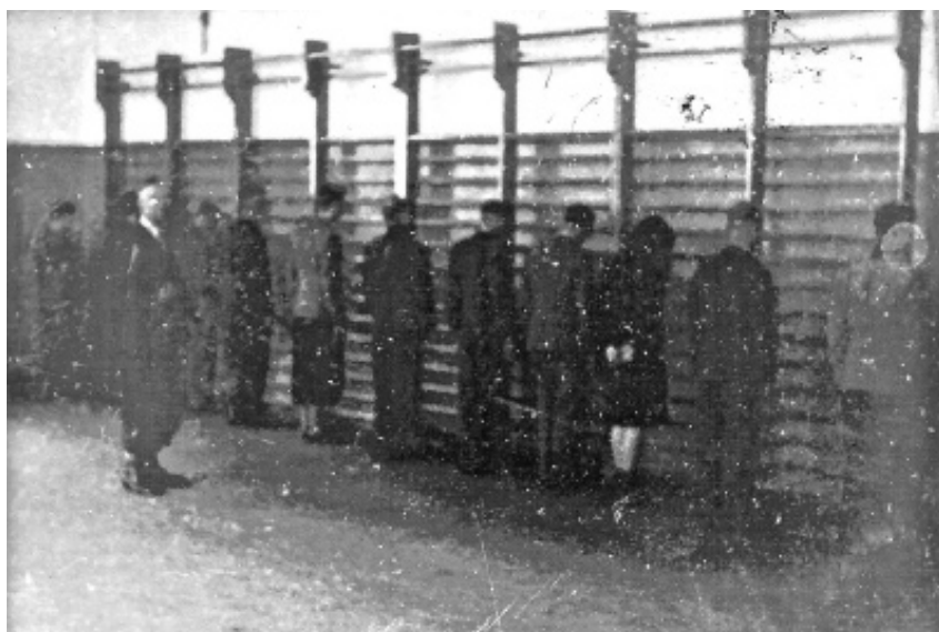
Opgebrachte Mannen en vrouwen voor klimrek en bewapende man in Openbare Van der Voort van Zijpschool.

Utrecht/Tuindorp, mei 2020, Rob Hufen Hzn.